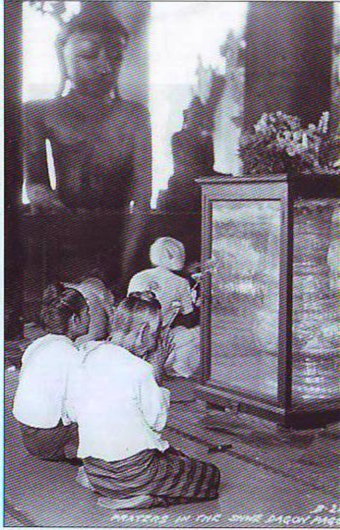
တန်ဆောင်းအတွင်း ဘုရားကန်တော့နေသော အဘွားနှစ်ဦးပုံ (မှန်သေတ္တာအတွင်းရှိ ငွေညောင်ခေတ်ကြီးမှာ ယခုအခါ ဘုရားပြတိုက်အတွင်း ပြသထားပါသည်။)

A picture of two old women paying homage to Shwedagon pagoda in a Da-zaung. A big silver vase seen in the glass-covered box is now displayed in the pagoda museum.