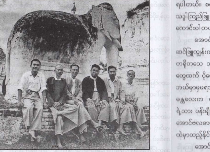
အောင်ဗလအကြောင်း ကူညီရှာဖွေပေးတဲ့ ဆင်ဖြူကျွန်းက မိတ်ဆွေများ

အောင်ဗလအကြောင်းများကို ဆင်ဖြူကျွန်းကမိတ်ဆွေတွေ ကူညီတဲ့အတွက် ပြည့်ပြည့်စုံစုံ လုံလုံလောက်လောက်ရပြီလို့တော့ မဆိုသာလှသေးဘူး။ ဒါကြောင့်