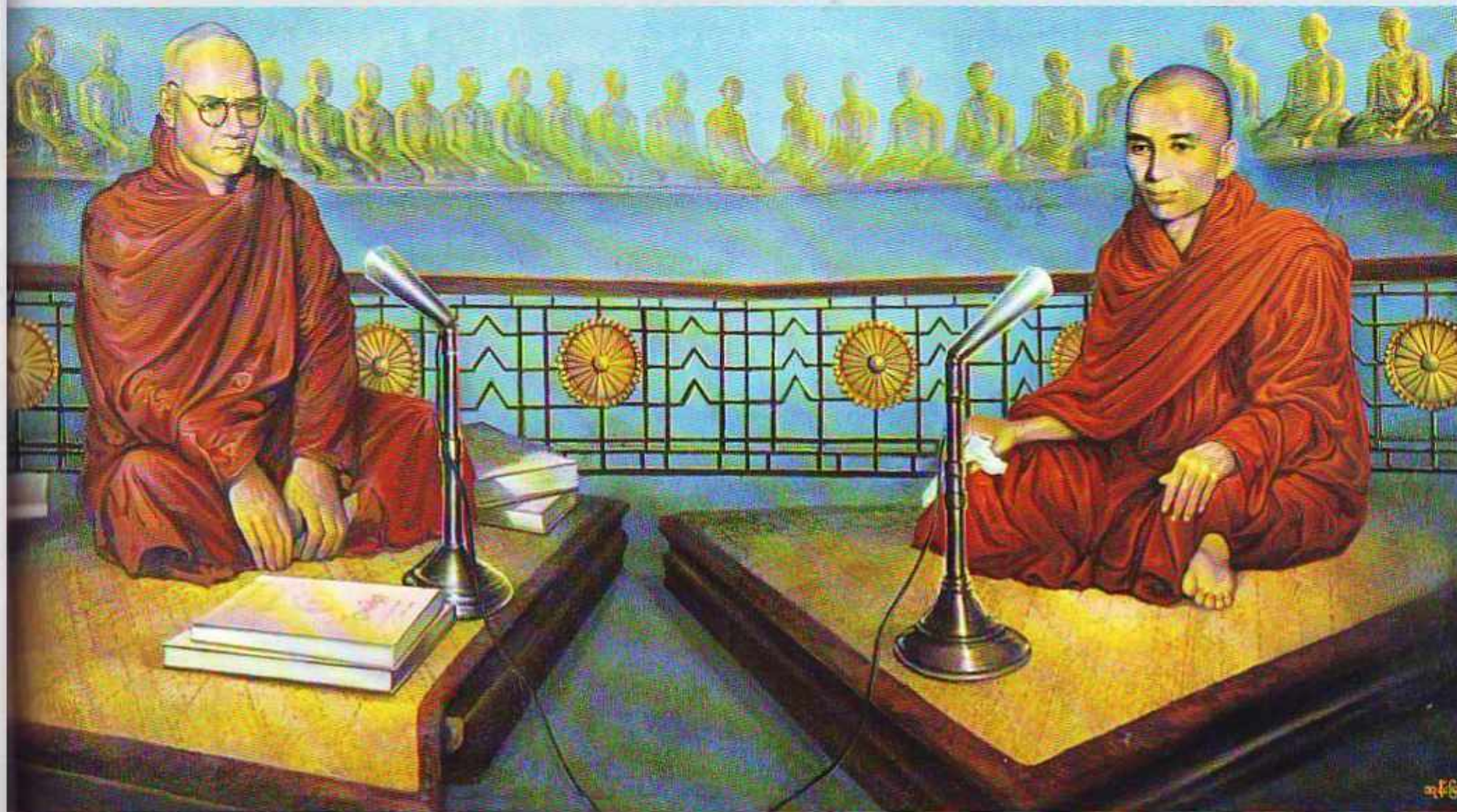
(၁၆) ဆဋ္ဌသံဂါယနာသဘင်၌ မဟာစည်ဆရာတော်ကြီး မေးသမျှကို မင်းကွန်းတိပိဋကဓရဆရာတော်ကြီး ဖြေဆိုနေပုံ

သီဟိုဠ်ရဟန်းတော်တို့က (လင်္ကာဒီပေပိ နတ္ထိ၊ ဇမ္ဗူဒီပေပိ နတ္ထိ။ ဤအရှင်ဝိစိတ္တသာရာဘိဝံသလို ပုဂ္ဂိုလ်မျိုး။ သီဟိုဠ် သီရိလင်္ကာ မှာလည်း မရှိ ဇမ္ဗူဒီပိမှာလည်း မရှိ) ဟု ချီးကျူးအံ့ဩစကား ဆိုခဲ့ကြပါသည်။