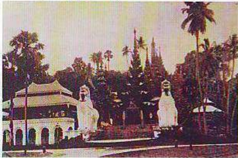
ရွှေဆံတော်စေတီ ရင်ပြင်ပေါ်တွင် ခေါင်းလောင်းများချိတ်ဆွဲ လှူဒါန်းထားပုံ (၁၉၃၀ ပြည့်နှစ်မြင်ကွင်း)