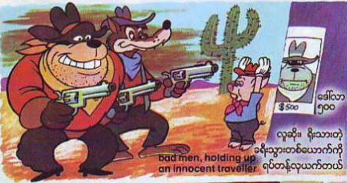
bad men, holding up an innocent traveller