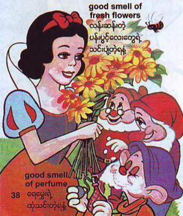
good smell of fresh flowers

လန်းဆန်းတဲ့ ပန်းပွင့်လေးတွေရဲ့ သင်းပျံ့တဲ့ရနံ့