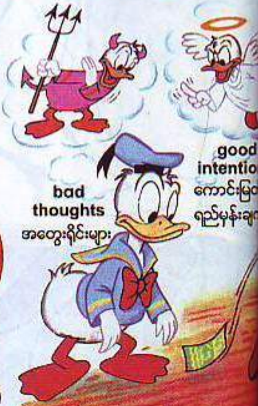
bad thoughts အတွေးရိုင်းများ