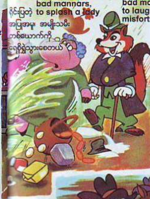
bad manners, ရိုင်းပြတ်တဲ့ အပြုအမူ အမျိုးသမီး တစ်ယောက်ကို ရေစိုခွဲသွားစေတယ်