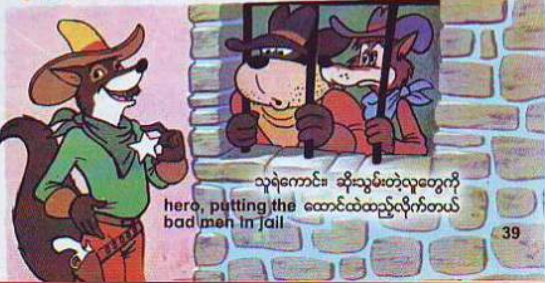
hero, putting the bad men in jail

လူဆိုး၊ ရိုးသားတဲ့ ခရီးသွားတစ်ယောက်ကို ရုပ်တန်လုယက်တယ်